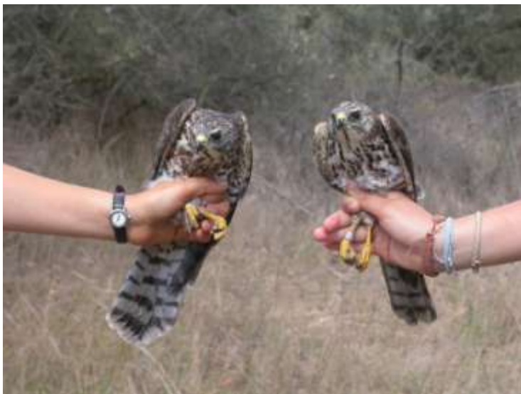
2 éperviers à pied court

Le Groupe des Jeunes (GdJ) a organisé un camp de baguage international, du 15 juillet au 10 novembre 2007 en Roumanie (Delta du Danube, Sfântu Gheorghe). Quarante-trois personnes de 10 nationalités, âgées de 14 à 60 ans, se sont relayées durant ces quatre mois pour assurer le baguage et la vie sociale du camp. Tous les participants ou groupes ont laissé une trace écrite de leur séjour sur notre blog ( http://GdJ.bleublog.ch ), que vous pouvez toujours consulter actuellement. Plusieurs bagueurs de l'association roumaine Milvus ont collaboré activement à notre projet, nous apportant une aide bienvenue. Au cours du camp, 7493 oiseaux de 101 espèces ont été capturés, tandis que 246 espèces ont été observées, dont certaines prestigieuses pour bon nombre de participants. Le rapport de la saison (en anglais) est disponible à l'adresse : www.nosoiseaux.ch/gdj .